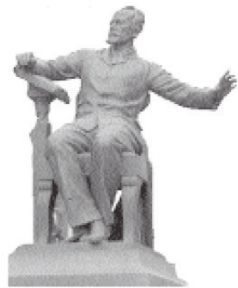
ВЫХОДИТ С 1998 ГОДА