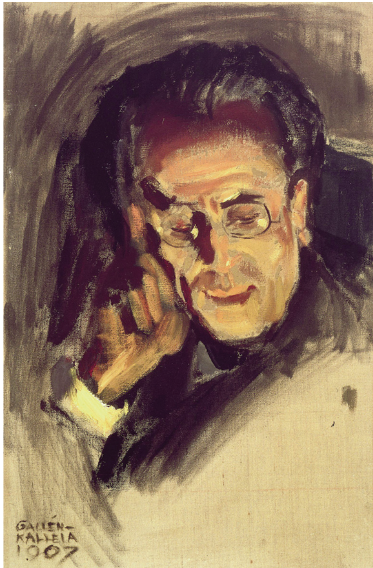
Аккели Галлен-Каллепа. Портрет Густава Малера. Холст, масло (1907). Художественный фонд Геста Серлакуса (Финляндия)

рыями должна была покрыться сама жизнь и история, чтобы идеалы внутренне гармоничного целого обнаружили свою относительность, дав место более заинтересованному и непредвзятому восприятию музыки Малера.