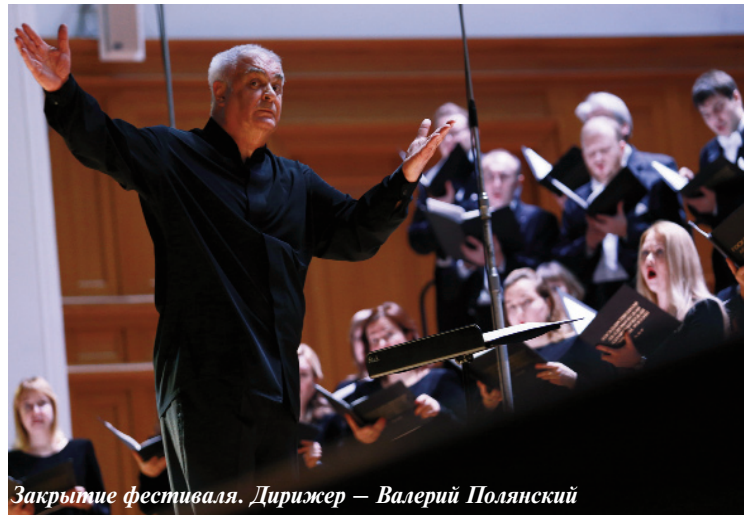
Закрытие фестиваля. Дирижер — Валерий Полянский

Закрытие фестиваля увенчалось дневным концертом снова в Большом зале консерватории. Программа состояла из произведе-