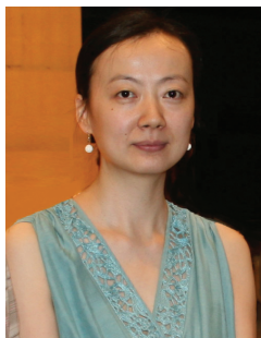
ХАО Чжоя (Пекин, Китай)

Размышления о будущем сольфеджио в мире и о будущем профессионального музыкального образования.